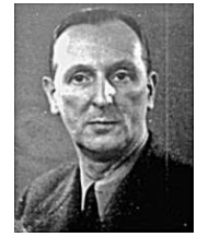
Abbildung 1: Passfoto, ca. 1938