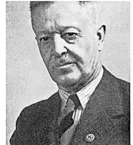
Abbildung 2: Passfoto, ca. 1936

Wilhelm Knoll 54 (1876 - 1958) war der erste (außerordentliche) Professor für „Leibesübungen“ in Deutschland, der nicht „ad personam“, sondern nach einer offenen Ausschreibung berufen wurde. Diese Professur wurde in Hamburg 1927 geschaffen und 1929 mit Knoll besetzt, einem Schweizer Militär- und Sportarzt.